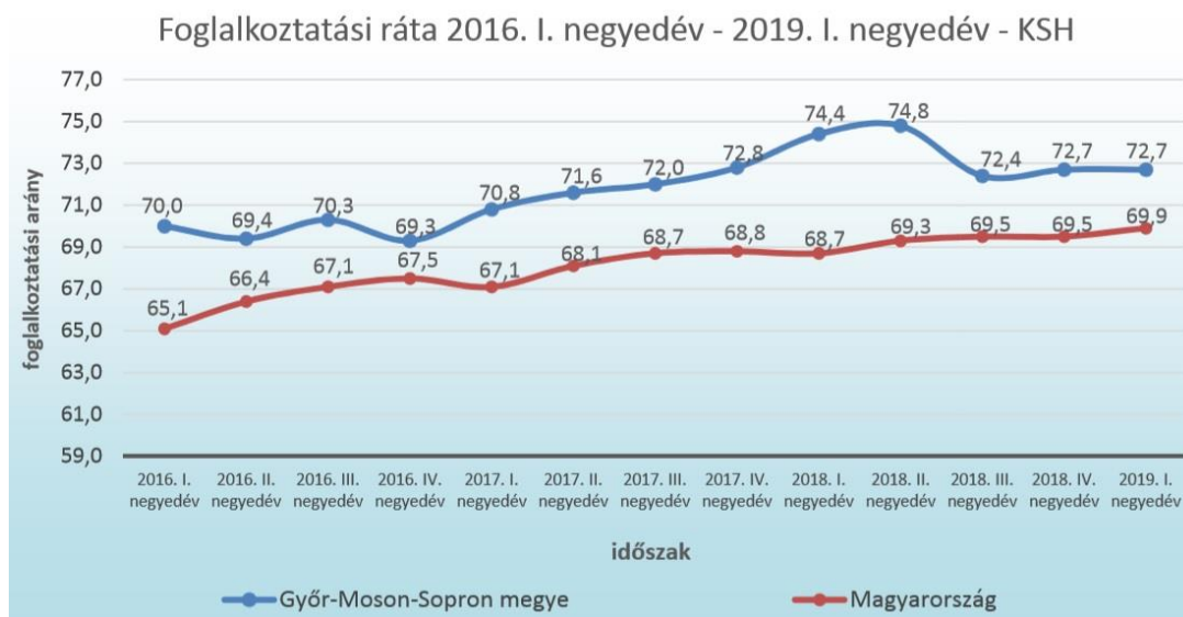
2. diagram: A foglalkoztatási ráta alakulása 2016. I. negyedév és 2019. I. negyedév között

2019. I. negyedévben megyei szinten a gazdaságilag aktív korúakat (15-64 évesek) 72,7%-os foglalkoztatási arány jellemzi, mely 1,7%-ponttal alacsonyabb, mint egy évvel korábbi érték. Győr-Moson-Sopron megye mutatója a csökkenés ellenére is tartósan magasabb – 2019. I. negyedévben 2,8%-ponttal – az országos átlagnál (2. diagram).